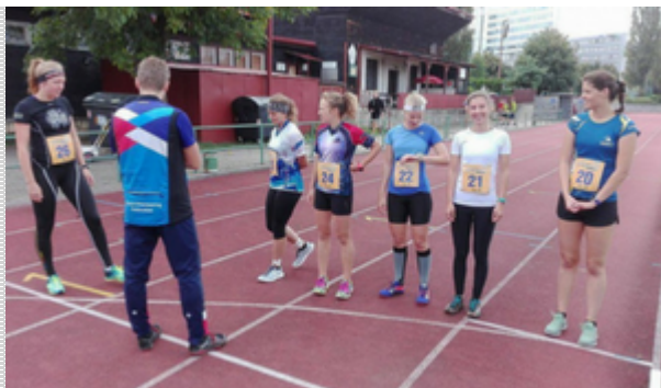
Momentka z testování v Praze (3.9.2017).

V září se uskuteční řada celostátních závodů v OB: