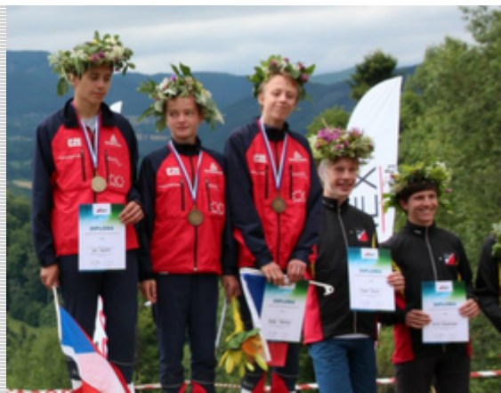
Bronzová štafeta dorostenců na stupních vítězů.

Do organizace Dnů orientace v přírodě, které jsou připravovány pro školní mládež a širokou veřejnost, je zapojeno 66 klubů, což je zhruba