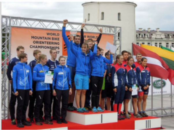
Česká reprezentace získala prvenství v klasifikaci národů.

V září se znovu naplno rozjede česká pohárová MTBO sezóna. O uplynulém víkendu bylo uspořádáno 14. a 15. kolo ČP v Maďarsku, v termínu 23. - 24. září další dvě kola ČP (middle, long) uspořádá TJ Tesla Brno na Masarykově okruhu v Brně.