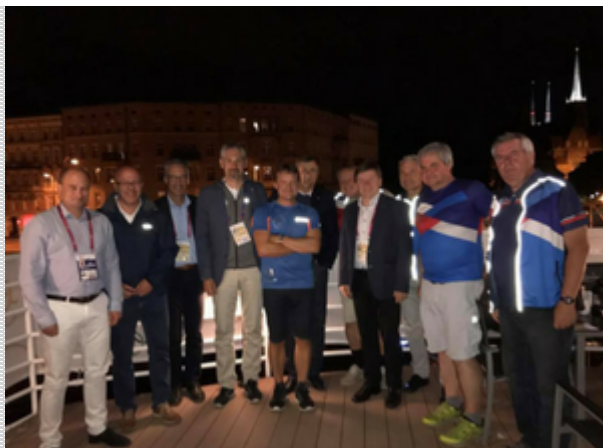
Společná fotografie zástupců IOF, ČSOS a ČOV.

Dva světové šampionáty byly přiděleny do ČR. Předsednictvo Mezinárodní federace orientačního běhu (IOF) projednalo na svém zasedání v estonském Tartu přidělení vrcholných mezinárodních akcí v nejbližších letech. Český svaz orientačních sportů uspěl s kandidaturou na uspořádání dvou světových šampionátů - v roce 2020 na MS v MTBO (Jeseník) a v roce 2021 na MS v orientačním běhu (Mladá Boleslav). Více informací o úspěšných kandidaturách zde , o dalších diplomatických úspěších ČR pak v tomto článku .